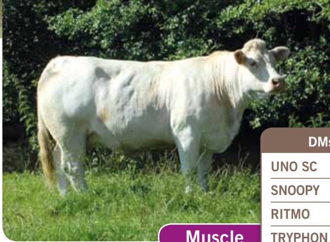
Fille de TRYPHON