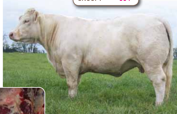
Fille de SNOOPY