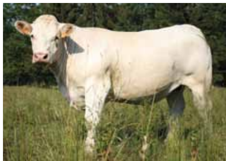
CENDRILLON (01) - Fille de VIRGIL SC

Ils confirmeront en facilité de naissance et développement musculaire, mais aussi en qualités maternelles (mère support très positive en IVMAT) et en variabilité génétique.