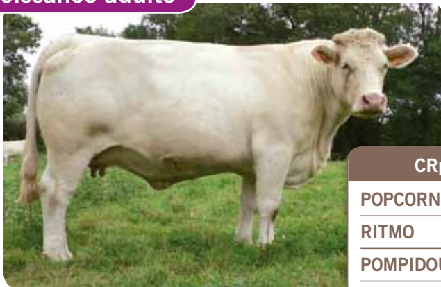
Fille de POPCORN