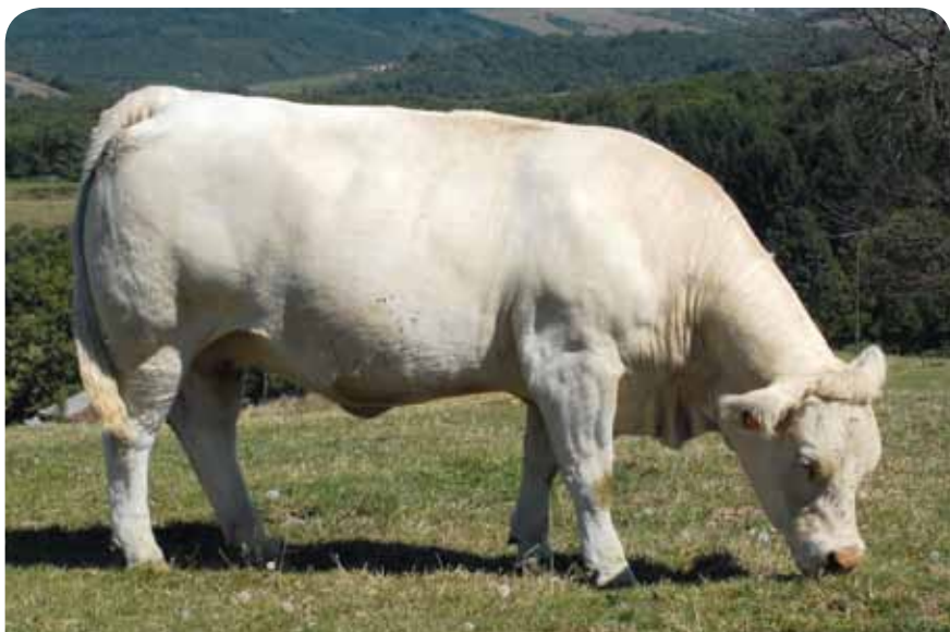
Fille de TAMILLY