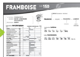
4 - indexation