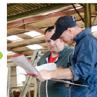
5 - conseil

Restitution et Commentaires des résultats par votre correspondant génétique