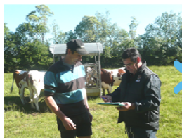
1 - choix des femelles